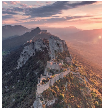
Château de Peyreperouse