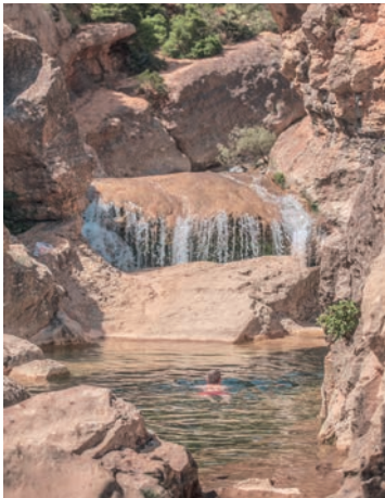
Gorges du Verdoble à Duilhac

Pour revenir au village, retourner au croisement, puis suivre le balisage jaune en direction de Duilhac. Suivre ce joli sentier en sous-bois puis prendre le chemin à droite (petite montée raide) qui ramène en 5 mn sur la départementale. Prendre à droite pour revenir au platane (200 m).